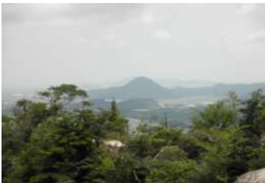
天狗岩から眺める三上山