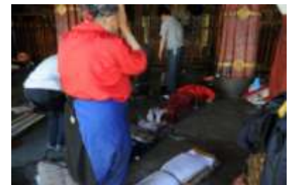
(写真2) 五体投地をする信者

その後、チベット仏教の総本山、大昭寺へ行く。五体投地(※体全体を使って行う、仏教において、最も丁寧なお祈りの仕方)をする人が多い。(写真2)