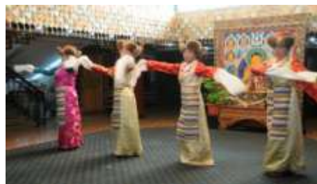
(写真3) チベット民族舞踊