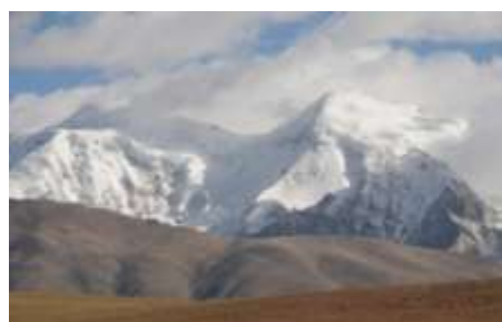
(写真5) チベット高原の山並み