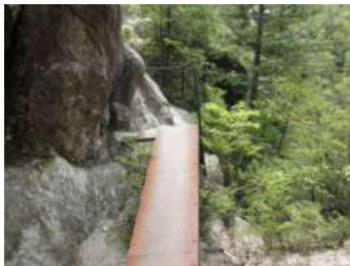
天狗岩に登る細道