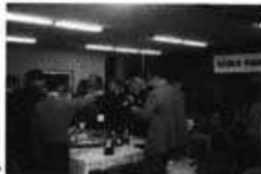
歓迎レセプションの様子▶