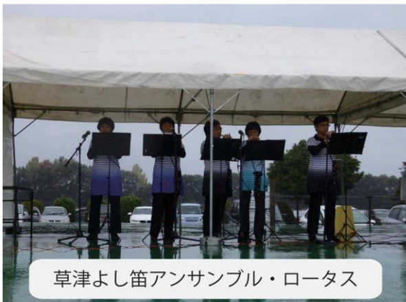
草津よし笛アンサンブル・ロータス