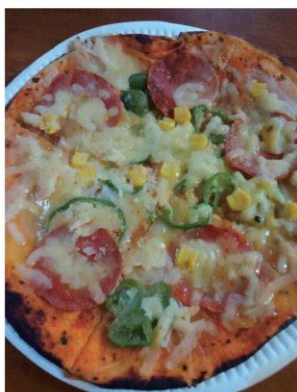
RIFA は好評の薪窯ピザを販売をしました！