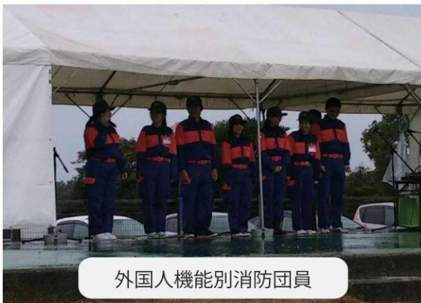
外国人機能別消防団員