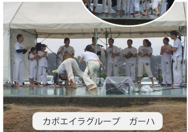
カポエイラグループ ガーハ