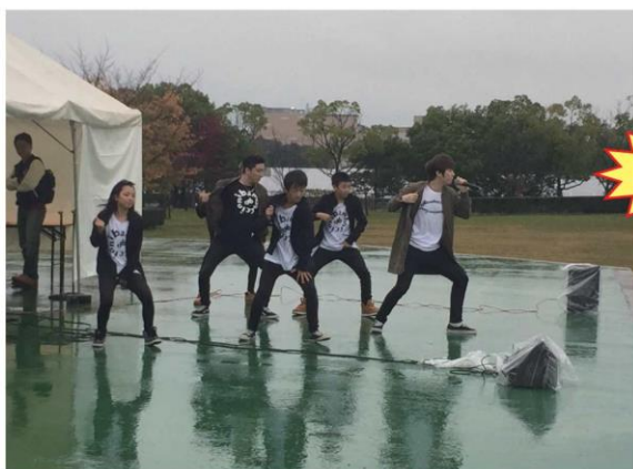
K-POP グループ X10