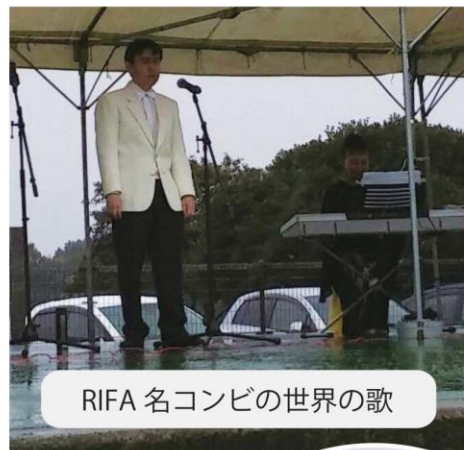
RIFA 名コンビの世界の歌