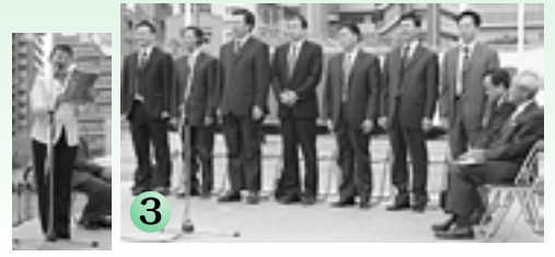
3 10時半よりセレモニー開始。 衡陽市使節団のみなさんも出席されました。