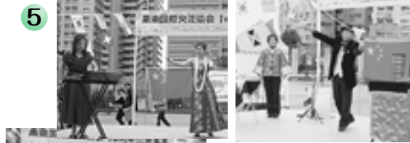
5 多彩なアトラクションから目が離せない！！