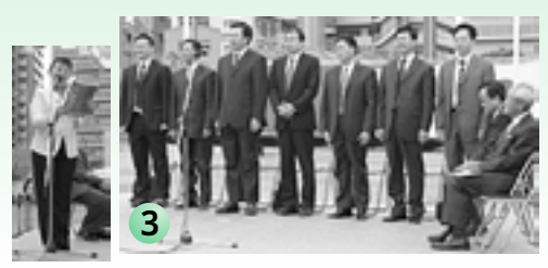
3 10時半よりセレモニー開始。 衡陽市使節団のみなさんも出席されました。