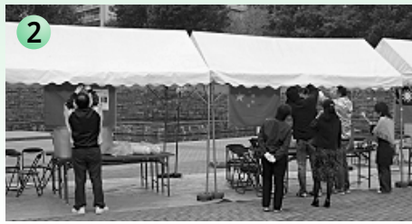
2 寒い！けど、雨はなんとか大丈夫！？ 当日は8時半から準備スタート！