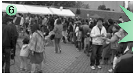
6 12時より屋台の販売開始。 予想以上の長蛇の列に、全員びっくり！