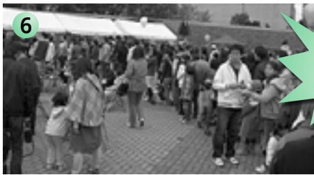
6 12時より屋台の販売開始。 予想以上の長蛇の列に、全員びっくり！