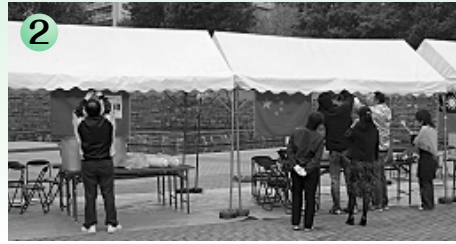
2 寒い！けど、雨はなんとか大丈夫！？ 当日は8時半から準備スタート！