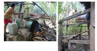
改良蒸留機の問題