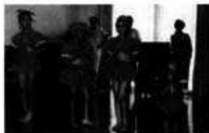
アフリカ音楽で踊るペルーのダンス