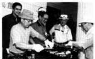
日本料理は「ウマイ焼」に挑戦