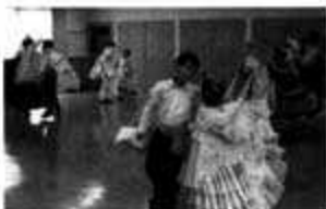
ペルーの民族舞踊マリネラを踊る子どもたち