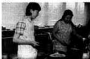
韓国料理チヂミはもうすっかり日本に定着「おいしい〜！」