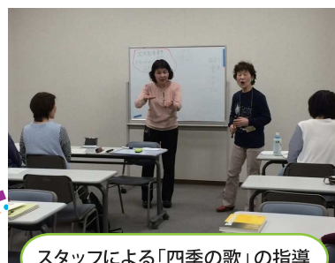
スタッフによる「四季の歌」の指導