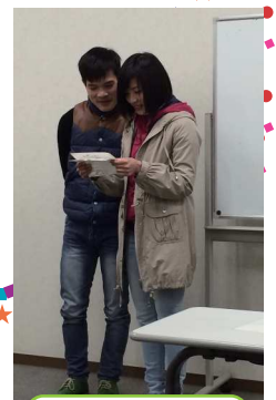
学習者の歌の発表