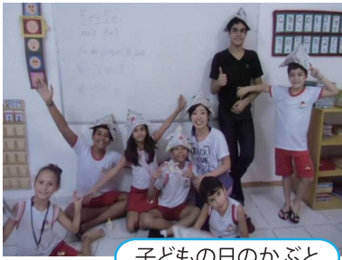
子どもの日のかぶと

いるよ」と注意を促すと、子ども達はすぐく言うことを聞いてくれたという事です。ブラジル