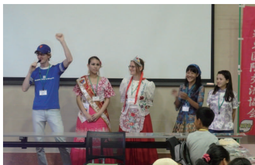
【講師】アメリカ、ペルー、ハンガリー、インドネシア、中国の先生