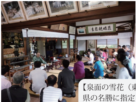
【泉面の雪花（東方山安養寺）】 県の名勝に指定されている近江八景を形どった庭園は、雪化粧されますと水面に咲く雪の花が実に見事です。

6月14日(日)、栗東国際交流協会とコミュニティセンター治田東共催で「栗東ロテリアウォークラリー」を開催しました。 栗東ロテリアウォークラリーとは、栗東ロテリアに掲載されている場所を歩いて、栗東の魅力を見よう!