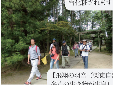
【飛翔の羽音（栗東自然観察の森）】 多くの生き物が生息し、自然に触れ、自然の大切さを体験できます。