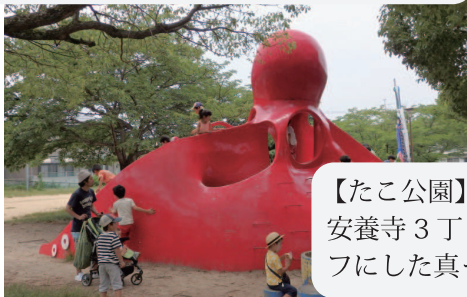
【たこ公園】 安養寺3丁目にある児童公園で、大きなたこをモチーフにした真っ赤なすべり台が子供たちに大人気です。

というイベントです。 当日はRIFA会員をはじめ、一般参加者の方々、外国籍の方々、総勢41名の方に参加して頂きました。 今回のウォークラリーのコースは、東方山安養寺↓栗東自然観察の森↓たこ公園です。 東方山安養寺では、いつもは開放されていない観音堂薬師堂、庭園を拝観し、貴重なお話を聞くことができました。 その後、栗東自然観察の森