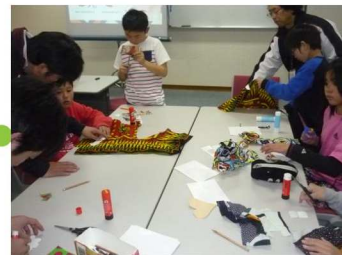
しおり作りに夢中!