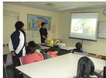
ケニアについてのお話