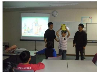
“カンガ”を巻き水運び体験