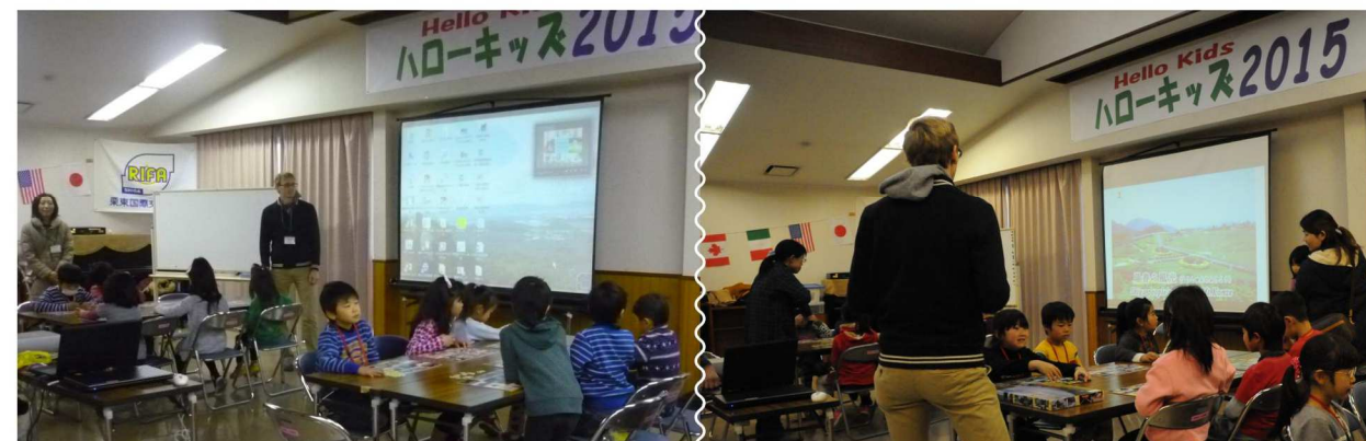
英語バージョンで栗東ロテリアを実施♪ 数字や単語の言い方の練習を交えながら楽しみました。

栗東市児童外国語学習 実施協議会主催のハロー キッズ2015が開催さ れ、市内の小学1~6年 生66人が参加してくれ ました。RIFAは栗東ロ テリアを英語バージョン で実施しました。 ハローキッズは、学校 の英語学習とは一味違 う活動内容で、外国人の先 生と楽しく遊びながら外 国語や異文化に触れても らうきっかけづくりをさ れています。今回は、ア メリカ人の先生3名とハ ンガリーの先生2名を招 き、2日間たくさんのプ ログラムを通して英語に 触れてもらいました。