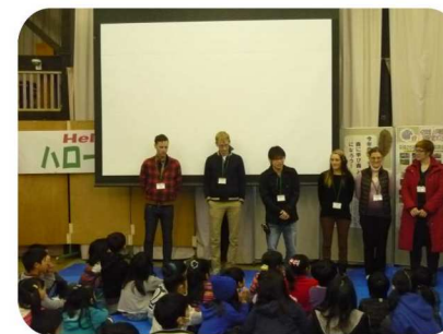
フレンドリーな講師陣

栗東市児童外国語学習 実施協議会主催のハロー キッズ2015が開催さ れ、市内の小学1~6年 生66人が参加してくれ ました。RIFAは栗東ロ テリアを英語バージョン で実施しました。 ハローキッズは、学校 の英語学習とは一味違 う活動内容で、外国人の先 生と楽しく遊びながら外 国語や異文化に触れても らうきっかけづくりをさ れています。今回は、ア メリカ人の先生3名とハ ンガリーの先生2名を招 き、2日間たくさんのプ ログラムを通して英語に 触れてもらいました。