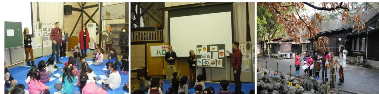
自然にあるものの単語(木・太陽・雲・葉など)を英語で学んでから、2日目は栗東自然観察の森を探索し、ネイチャーゲームを実施しました。