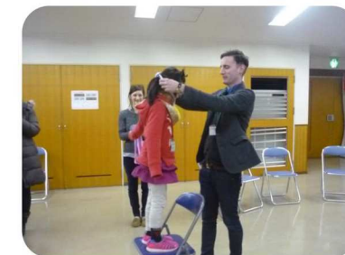
ロテリアで上がり(=ビンゴ)の子どもたちに先生からくりちゃんメダルをかけてもらいました。