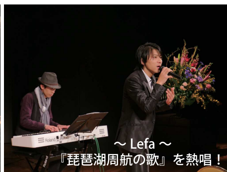
～Lefa～ 『琵琶湖周航の歌』を熱唱!