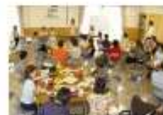
様々な人と知り合いに、

各国の講師の方の紹介の後、4つのグループに分かれて、料理をしました。グループごとに、料理の手順や、雰囲気の違い、見ているだけで、文化の違いを感じます。