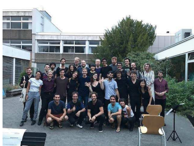
ダルムシュタット現代音楽夏期講習にて 作曲家と打楽器奏者の参加者