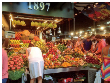
スペインバルセロナの 色鮮やかな市場