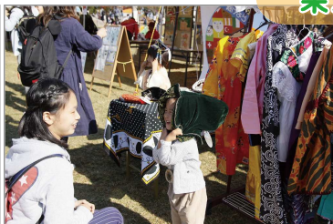
世界の民族衣装を着てみよう!