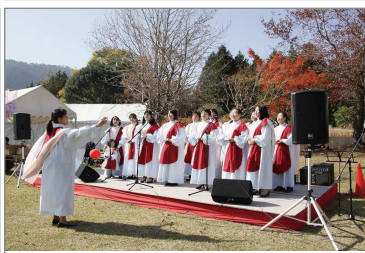
ゴスペル 『Soul of Lake』