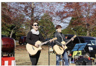
K-pop 『Two Brothers』