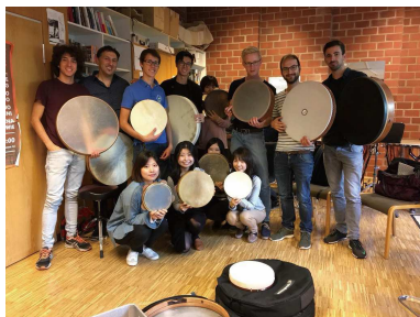
ハンドドラムのマスタークラスにて

このように色々な国で演奏活動をしながら打楽器を学ぶ事ができ感謝しています。そして何と言っても、人と人との出会いや繋がり大切さをいつも強く感じます。打楽器の世界をより多くの人に知ってもらえるよう、精進して参ります。2014年からフライブルク音楽大学で出会った韓国人の仲間と打楽器デュオを組み、演奏活動や作曲家との交流も積極的に行い、日本公演、韓国公演ができるよう企画も進めています。また皆さまにお会いすることができますように。