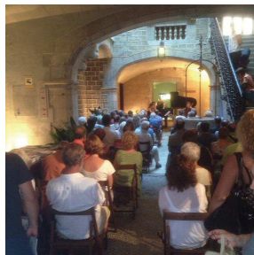
スペインバルセロナでの 音楽フェスティバル