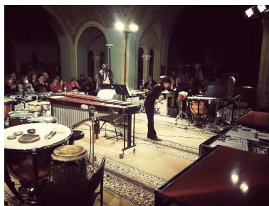
ウクライナ オデッサにて 真夜中の演奏