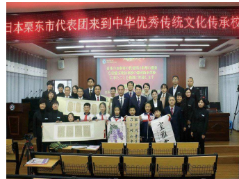
都司街小学校での記念撮影