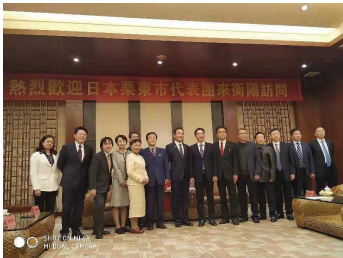
衡陽市へ表敬訪問