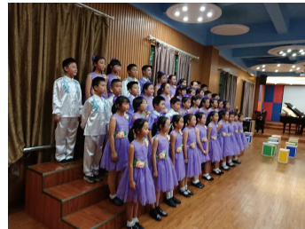
実験小学校での合唱