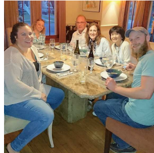
ホームステイ先でのパーティ