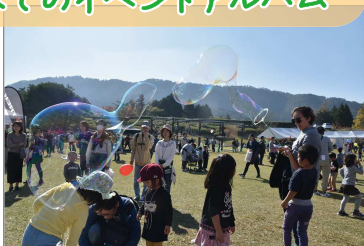
ジャンボシャボン玉