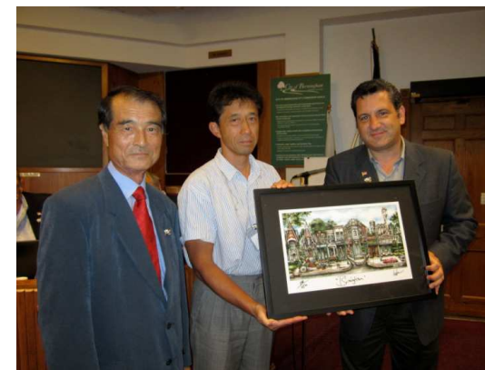
←バーミングハム市の市内風景画をいただきました。 栗東市役所1階、国際交流展示コーナーに展示中

バーミングハム市の素晴らしさをまだ紹介しきれないですが、紙面の都合で終了します。今回多くの素晴らしい体験が出来たことを改めて感謝し報告とします。