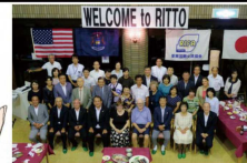
姉妹都市から来たお客様を、 みんなで歓迎しました。