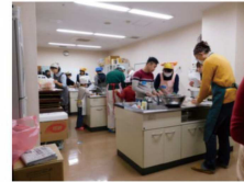
ベトナム人と一緒に、 ベトナム料理を作って、 みんなで美味しく食べました。