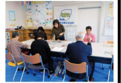
自作したロテリアで、 栗東の名所を学びました。