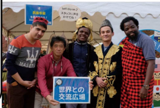
国際交流を率先します。