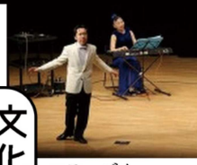
ステージを 盛り上げます。