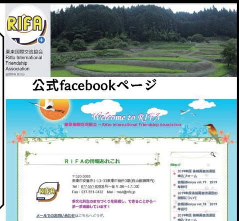
公式ホームページ