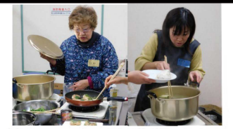
料理イベントで調理指導します。