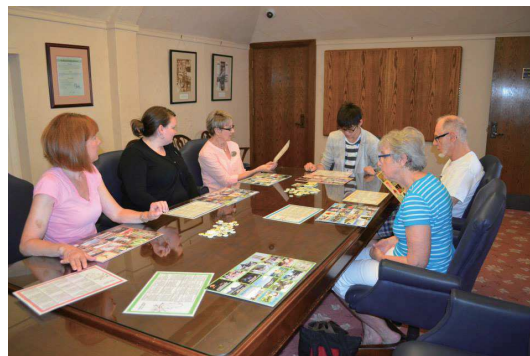
バーミングハム市でのロテリア披露