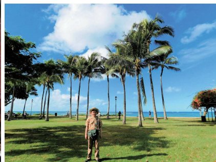
ヤシの木が巨大なワイキキビーチ