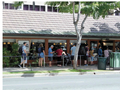
行列ができる人気の丸亀製麺