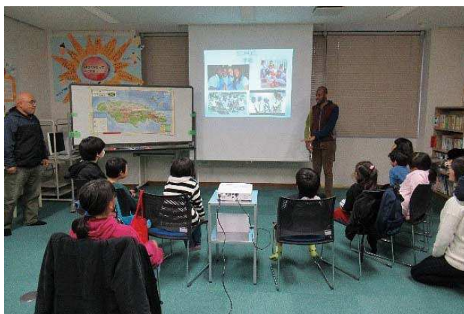
ジャマイカの紹介