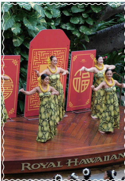
フラダンスの公演