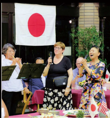
姉妹都市交流で バーミンガム市長と 一緒に歌いました。