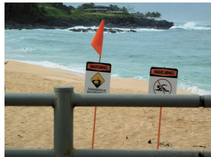
遊泳禁止の看板が掲示されている1月のノースショア海岸