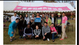
りっとう市民秋まつりで、 JICA研修生と交流しました。