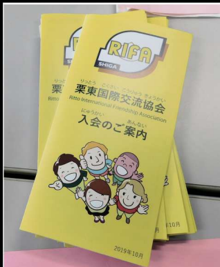
入会のご案内 (2019年改訂)