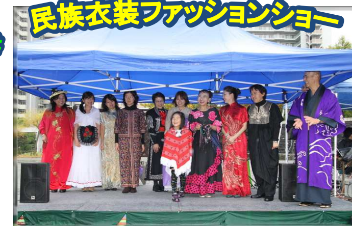
民族衣装ファッションショー