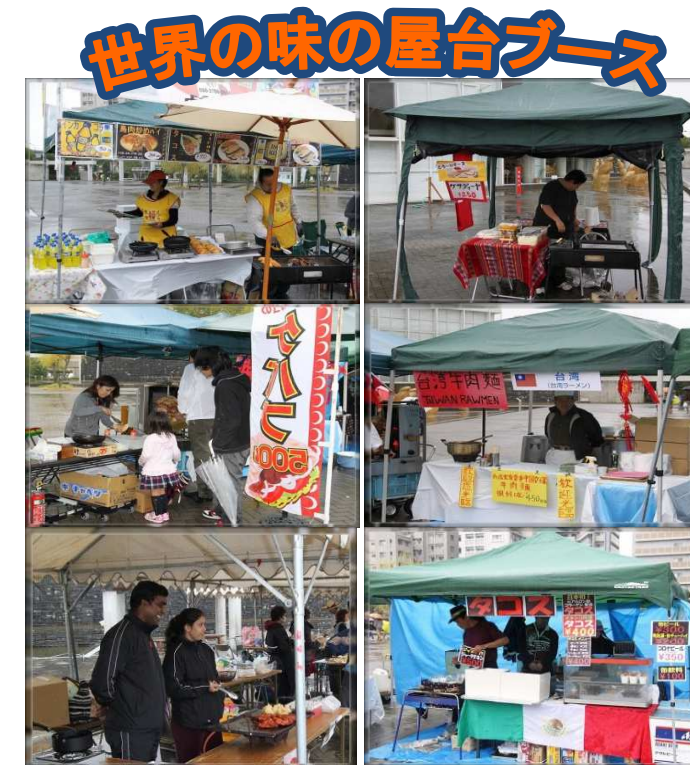
世界の味の屋台ブース