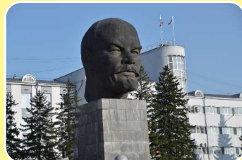
ソビエト広場のレーニン頭部像