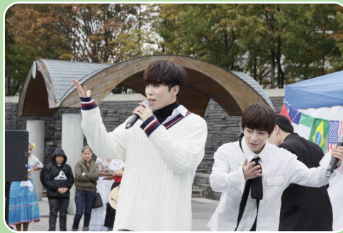
韓国アーティスト「Rève (レイヴ)」