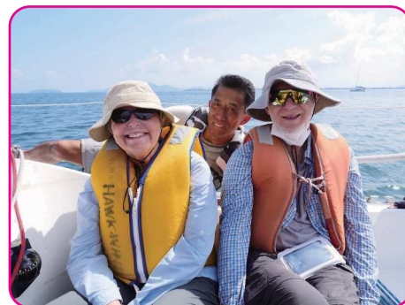
琵琶湖でセーリング