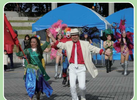
サンバカーニバル「アクアレーラ」