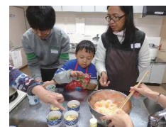
昨年の Japanese Cooking、 茶わん蒸し作りの様子