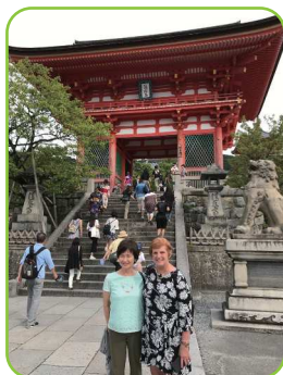
清水寺 in 京都