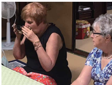
流しそうめん&お茶会