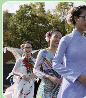
ベトナムモダンダンス 「在滋賀ベトナム青年会」