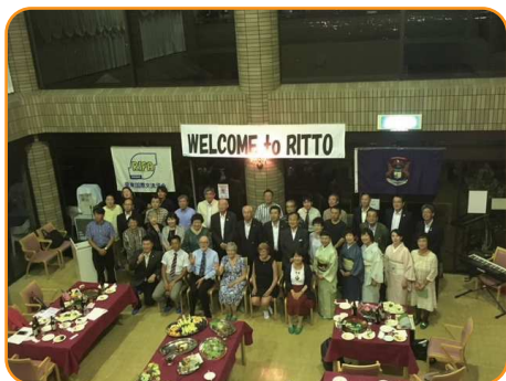
栗東国際交流協会歓迎会 in 森遊館