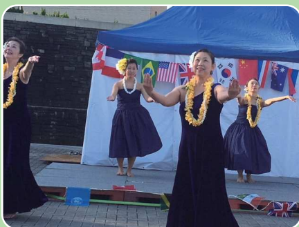
フラダンス「カウホラ」