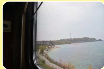
シベリア鉄道からのバイカル湖の景色