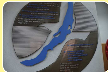
バイカル湖博物館 in イルクーツク