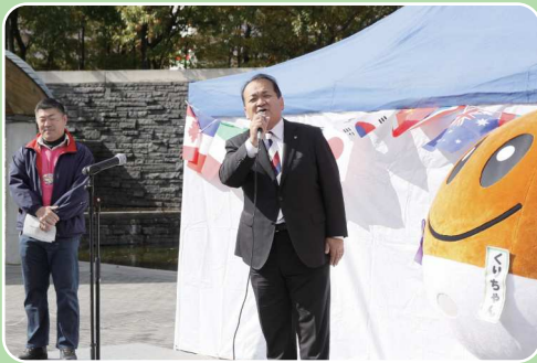
オープニング 来賓挨拶 栗東市長、くりちゃん