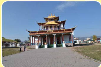
イヴォルギンスキー・ダツァン in ウランウデ