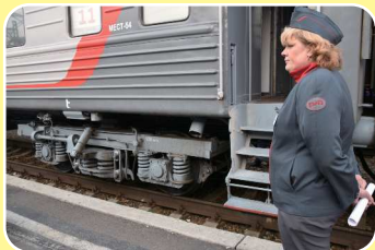
シベリア鉄道の東の出発点となる駅