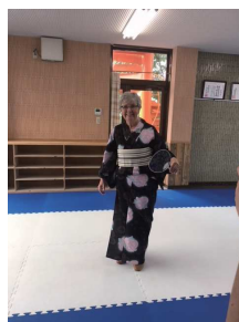
みそ作り、空手教室&着付け