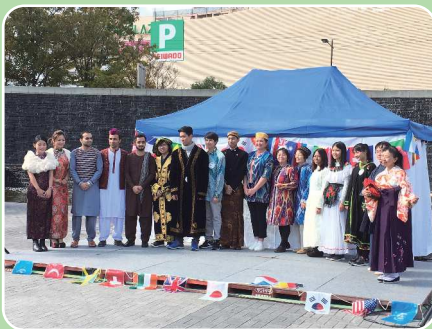
民族衣装ファッションショー